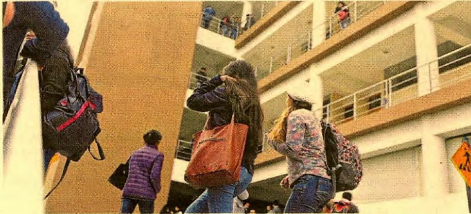
Oferta. Actualmente existen a nivel nacional unas 91 universidades privadas.

La escala más alta llegó a a un incremento de hasta 15%. Ya hay siete casa de estudio superior con mensualidades de más de S/ 4,000. Alas Peruanas y César Vallejo son las más masivas.