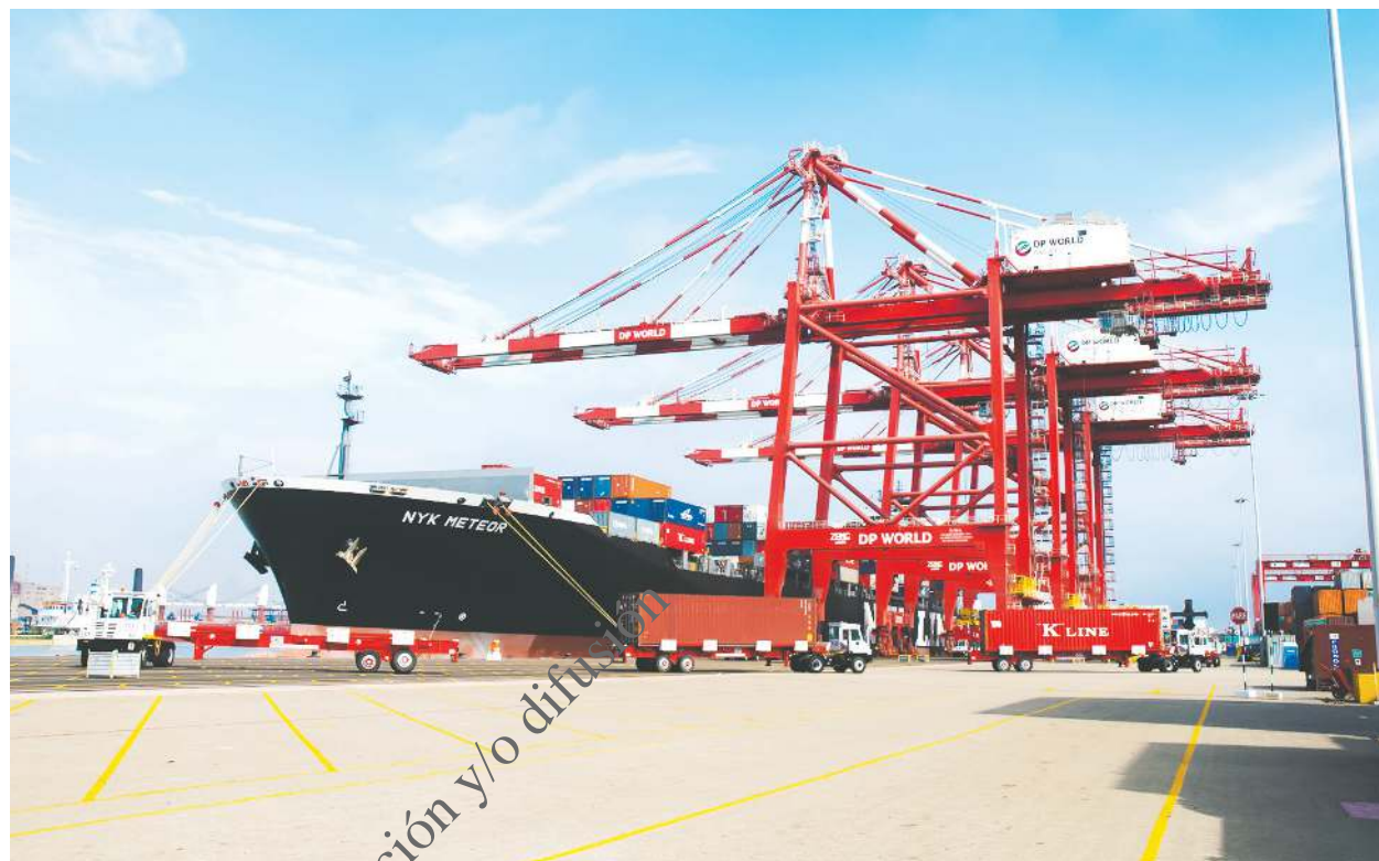
Respaldo. Mientras se mantengan robustos los fundamentos macroeconómicos, nuestra economía seguirá creciendo.

“Hay que reconocer que después de un par de años en que llegó la pandemia que se afrontó con una significativa expansión del gasto fiscal y aumento de la deuda públi-