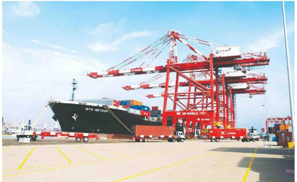
Respaldo. Mientras se mantengan robustos los fundamentos macroeconómicos, nuestra economía seguirá creciendo.

"Hay que reconocer que después de un par de años en que llegó la pandemia que se afrontó con una significativa expansión del gasto fiscal y aumento de la deuda públi-