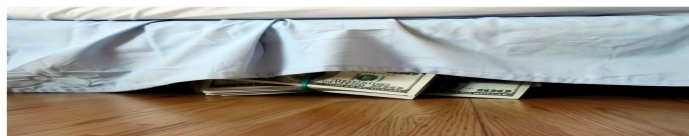
Ahorros, dinero, plata guardada, recursos, savings (Imagen ilustrativa Infobae)

Desahorro financiero: ocurre cuando se utilizan préstamos a corto plazo para financiar activos a largo plazo, o cuando se toma deuda en una moneda diferente a la de los ingresos. Esto puede generar problemas si las condiciones económicas cambian. Es esencial que los jóvenes comprendan la importancia de alinear los plazos de sus deudas con sus ingresos y asegurarse de que los préstamos sean en la misma moneda, minimizando así riesgos financieros.