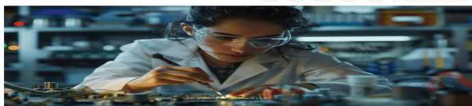
Mujer peruana profesional técnica soldando una placa electrónica con precisión y habilidades especializadas.

Las carreras en STEM son accesibles para todos, no obstante, el porcentaje de mujeres que las eligen es muy bajo. En tanto, del grupo de estudiantes que deciden seguir estas carreras, muy pocas llegan a ser investigadoras.