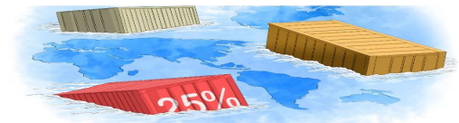
La miopía de la administración Trump demuestra, una vez más, no entender los beneficios del "soft power". (Ilustración: Lavida)