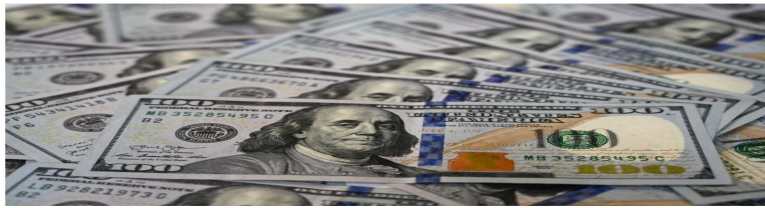
La sostenibilidad fiscal de EE.UU. ha puesto en duda el futuro del dólar como reserva global.

Aunque es posible que ingresen capitales al país, la desaceleración del crecimiento global podría afectarnos. El sector exportador sería el más perjudicado.