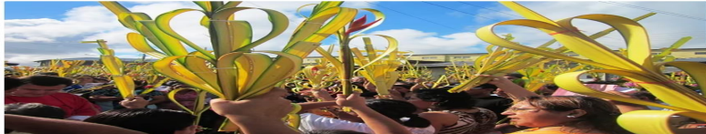
La fe peruana se manifiesta en la fiesta, la danza y la música. Así celebran los creyentes en Iquitos.

Esto, por supuesto, no niega el crecimiento: según el titular del Ministerio de Comercio Exterior y Turismo (Mincetur), Juan Carlos Matamoros, se proyecta que el movimiento económico en esta festividad ascienda a los 195 millones de dólares (38 millones de dólares más que el 2023). Asimismo, un cálculo hecho por la Red de Estadísticas para el Desarrollo (RedeD) indicó que se prevé que el gasto promedio por turista sea de 1,100 soles (300 soles más que el 2023).