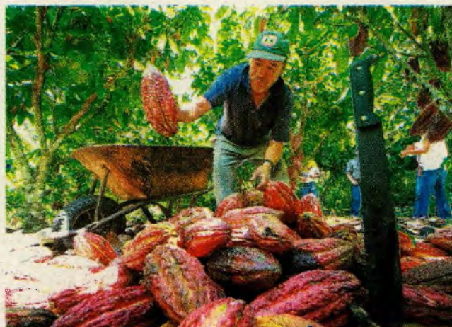
ECONOMÍA. Son 30 mil familias que dependen del cacao.

La otra mitad corresponde a los productos derivados. La